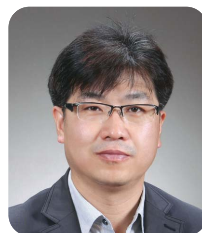
이 명 수 한국한의학연구원